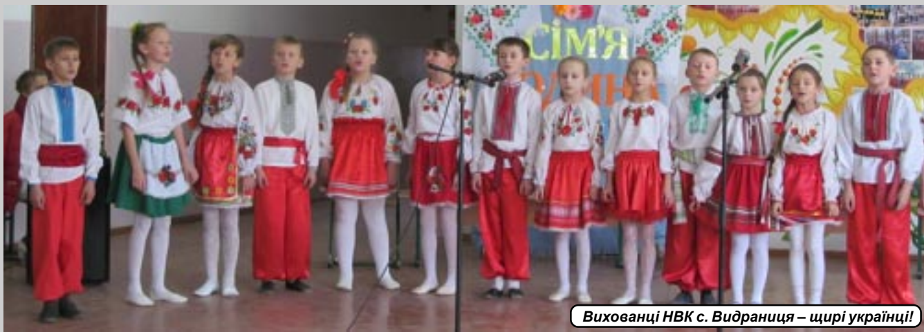
Вихованці НВК с. Видриця – щирі українці!

на сучасну, а гравців було по 12 з кожного боку. Перша книга з шашок вийшла в Іспанії в 1547 році. Сьогодні в шашки грають мільйони. Гра визнана вчителями як хороший спосіб розвитку логічного мислення. Люди після довгої хвороби за рекомендаціями лікарів грають у шашки, гра допомагає одужанню.