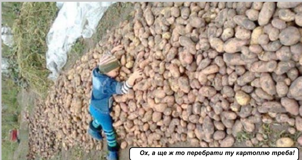
Ох, а це ж то перебрати ту картоплю треба!