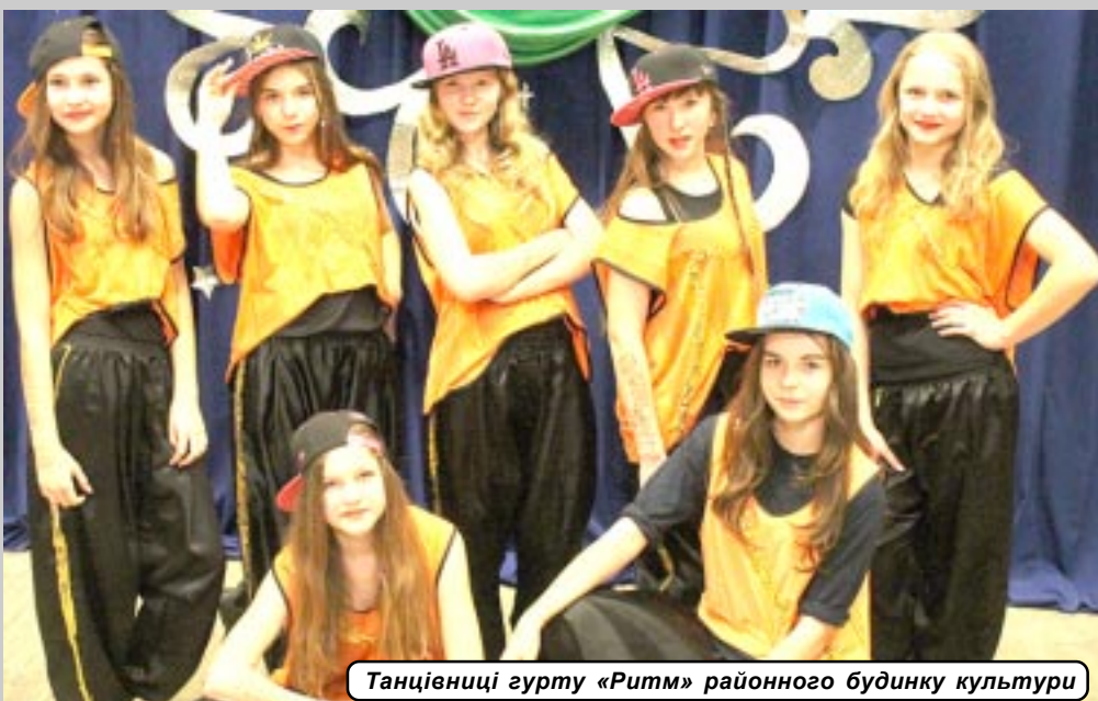
Танцівниці гурту «Ритм» районного будинку культури

З давніх часів до нас дійшло цінне зауваження для рибалок: якщо грім у пісний день (середа і п'ятниця) – у рибалок буде хороший улов риби.