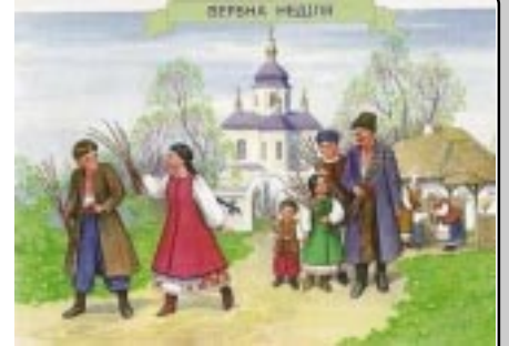
Юні грації

Дехто стверджує, що на Русі використовували вербу для припинення бурі, граду, пожежі. Споконвіку вона захищала