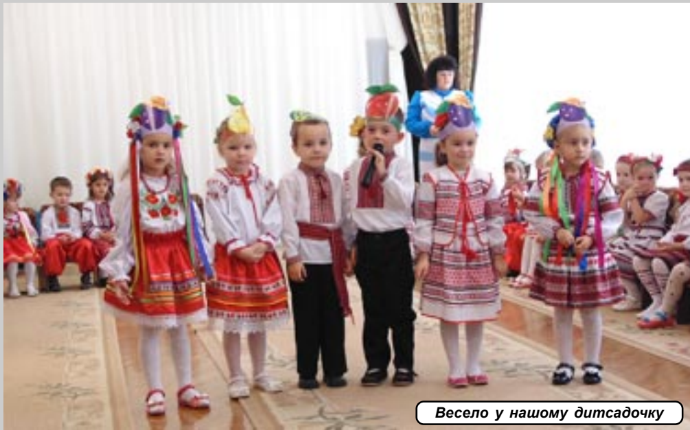
Весело у нашому дитсадочку

21 ЛИСТОПАДА - Альберт, Марфа, Михайло. 22 - Олександр, Антон, Юхим, Іван, Мотрона, Порфирій, Семен, Тимофій. 23 - Нестор, Орест, Родіон. 24 - Вікентій, Віктор, Максим, Степан (Стефан), Степанида (Стефанида), Федір. 25 - Опанас, Іван, Каріна, Лев, Микола, Сава. 26 - Герман, Іван, Никифор. 27 - Григорій, Костянтин, Пантелеймон, Феодора, Пилип.